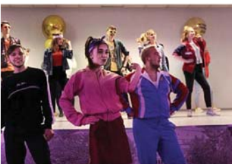
studnews_nsuem Привет всем, кто уже проснулся! 🤪 На фото - победители фестиваля! команда БЮРО БОБРА 🤪🤪🤪