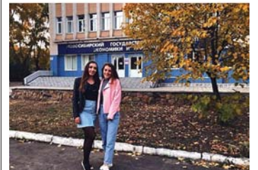
Нравится: 99 igerlinger Осень 🍂, универ 🏫, 🐱 🐶 🍷 🍷 🍷 #новосибирск #нгуэу