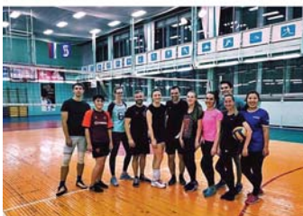
Нравится: 104 baneeva Собиралась на бег, а пошла открывать сезон по волейболу #нгуэу и #кпмгновосибирск 💙 Не успела... ещё