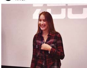
_zoom_tv_ Хэй, первак! Как тебе первое собрание ZOOM TV ? Надеемся вам все понравилось и вы так же как и мы зарядились позитивом и мотивацией для дальнейшей работы 🤪 А пока ловите фотоотчет с собрания и не