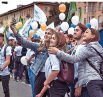
Нравится: 166 vicoriakorova Студенчество - поистине замечательный период жизни 🤪