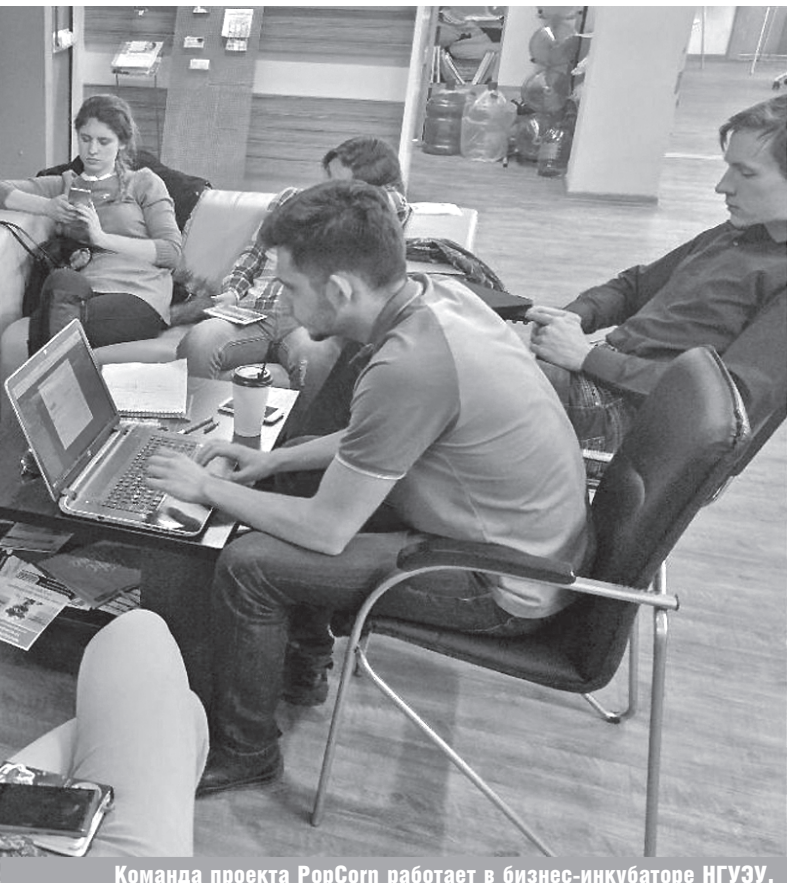
Команда проекта PopCorn работает в бизнес-инкубаторе НГУЭУ.

зарегистрированного агентства, а также уже сформированную команду, в которую входят веб-дизайнер, верстальщик, специалист по контекстной рекламе, менеджер интернет-проектов. Сейчас команда расширяет спектр оказываемых услуг и клиентскую базу.