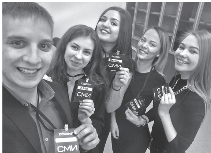
Среди победителей последнего этапа конкурса студенческих инициатив — команда ZoomTV. Сейчас ребята ждут закупку новой техники, разрабатывают нестандартные форматы и принимают новичков в свои ряды!

Одним из главных, на наш взгляд, условий выступает то, что заявленные на конкурс про-