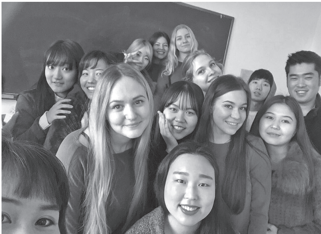
Во время обучения в Китае есть возможность познакомиться со студентами из разных стран.

Сейчас, мне кажется, я лучше понимаю этот язык, стажировка дала мне возможность прикоснуться к китайской культуре и приобщиться к китайскому менталитету, я под другим углом взглянул на мир, а также приобрел новых друзей.