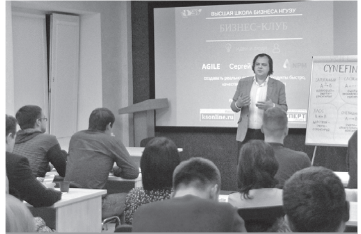
Базовым PR-инструментом Высшей школы бизнеса стал бизнес-клуб, встречи которого проходят ежемесячно.

При этом, конечно, нам есть чему учиться у больших университетов. В Сибири это Томский государственный университет, Томский политехнический университет, Сибирский федеральный университет, поблизости — Уральский федеральный университет, а также необходимо перенимать опыт у Санкт-Петербургского государственного университета и у московских вузов. Нам стоит обратить внимание на внутреннее содержание их программ, организацию процесса, набор компетенций, который они предлагают слушателям.