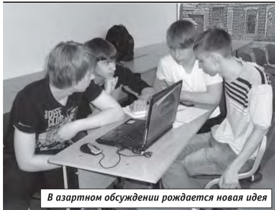
В азартном обсуждении рождается новая идея