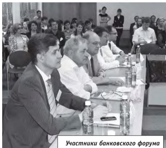
Участники банковского форума