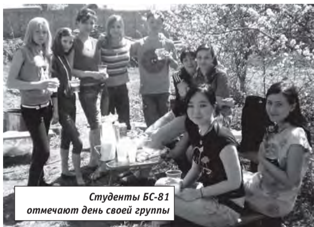
Студенты БС-81 отмечают день своей группы

Кроме университетских, у группы БС-81 есть еще и собственные праздники. Например, студенты вместе встречают Новый Год. Но самый любимый праздник – день группы. Чтобы определить, когда именно его отмечать, будущие специалисты по статистике прове-