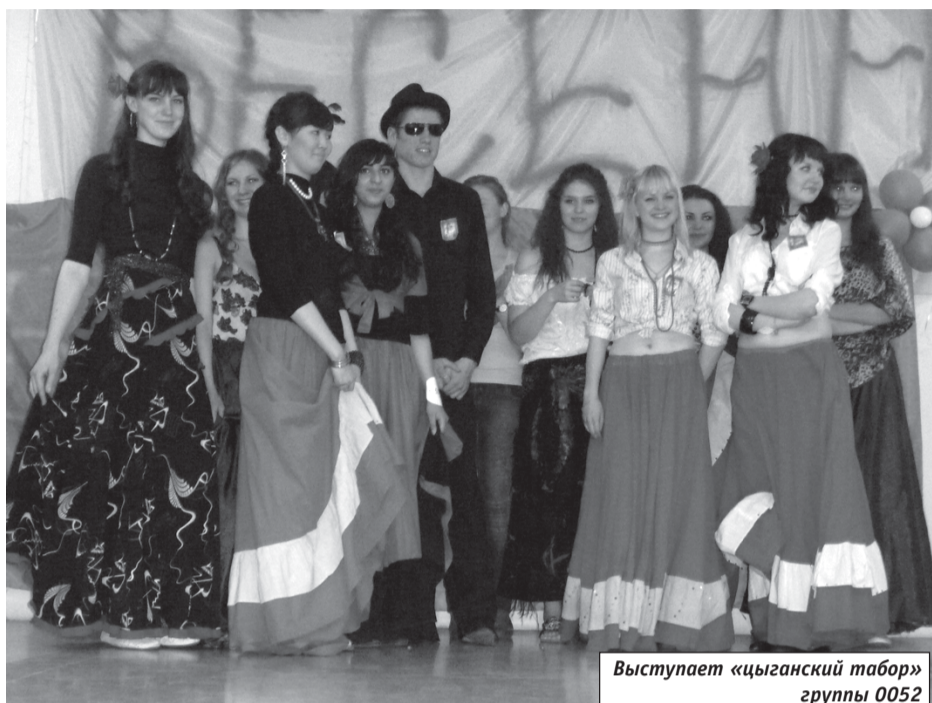
Выступает «цыганский табор» группы 0052

Прошлой весной в институте экономики появилась новая традиция – был проведен праздник первокурсников «Весеннее обострение». Старшие товарищи решили испытать младших коллег, а судейская коллегия из деканата института решала, какая же группа самая талантливая, самая сплоченная, самая яркая. Праздник получился настолько удачным и веселым, что было решено сделать его традиционным.