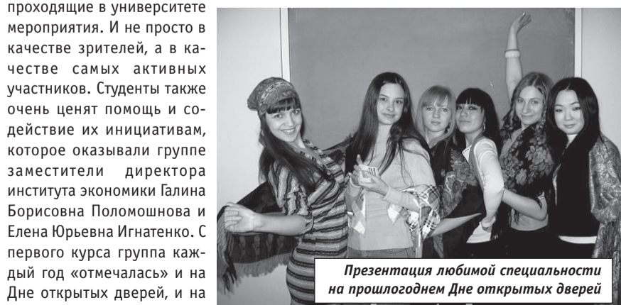
Презентация любимой специальности на прошлогоднем Дне открытых дверей