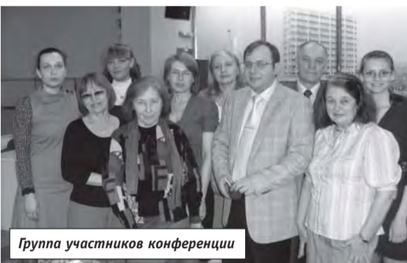
Группа участников конференции