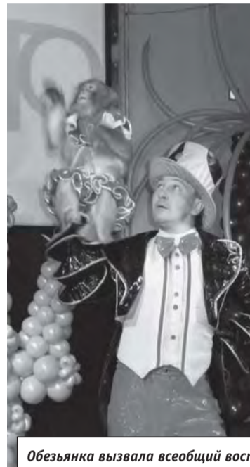
Обезьянка вызвала всеобщий восторг