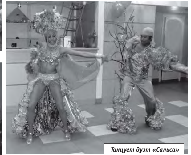
Танцует дуэт «Сальса»