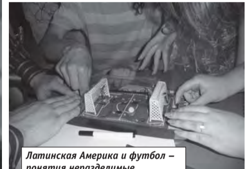
Латинская Америка и футбол – понятия неразделимые

Латинская Америка – родина бесконечных мильных опер и бесчисленного количества диких обезьян... Под ее жарким солнцем мечтал прогуливаться в белом костюме великий комбинатор Остап Бендер. Она подарила нам Пеле – «парохода и человека», то бишь одного из лучших футболистов мира и одноименную марку кофе, – и много-много других чудес. Исследовать феномен этой части света студенты НГУЭУ отправились на океанском лайнере «ПРО ЭкТО», достигшем желанных берегов 28 апреля ровно в 17 часов.