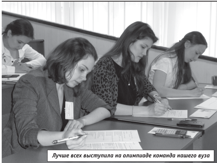
Лучше всех выступила на олимпиаде команда нашего вуза