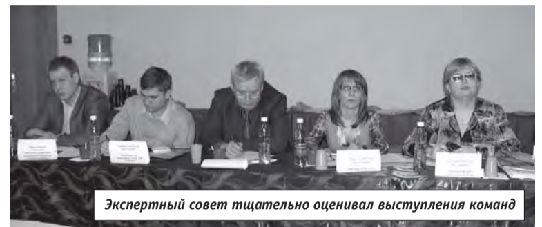
Экспертный совет тщательно оценивал выступления команд

В ходе выполнения первого задания командам нужно было решить