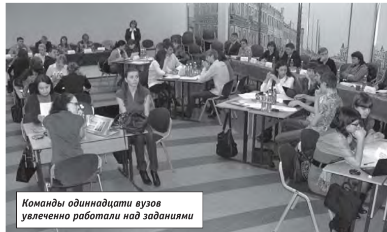
Команды одиннадцати вузов увлеченно работали над заданиями