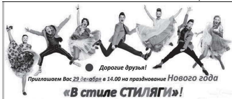
Дорогие друзья! Приглашаем Вас 29 декабря в 14.00 на празднование Нового года «В стиле СТИЛЯГИ»!

В программе праздника зажигательные композиции группы «ONLINE», «стиляжные» танцы от «FLEX5», песенные конкурсы под живую музыку – и все это в актовом зале второго корпуса. Приветствуются и награждаются цветные «коки», яркий макияж и умопомрачительные «прикиды». Отдельный приз – самому стильному галстуку.