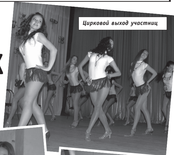
Цирковой выход участниц