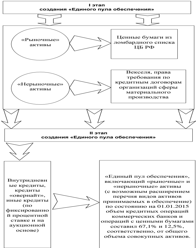
Рисунок 3 – Этапы создания Центральным банком Российской Федерации «единого пула обеспечения»

В диссертационном исследовании предлагается продолжение создания ЦБ РФ «Единого пула обеспечения», который включает в себя рыночные и нерыночные активы (рисунок 3).