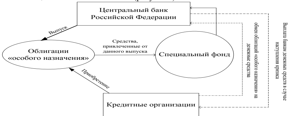
Рисунок 2 - Схема использования облигаций «особого назначения» Банка России кредитными организациями

В рамках инерциального сценария автором рекомендовано ЦБ РФ выпускать облигации «особого назначения» (рисунок 2).