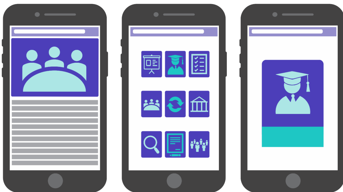
Рисунок 4. Размеры элементов должны быть согласованы с размером экрана