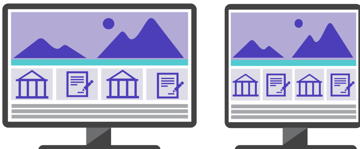
Рисунок 5. Корректное отображение на экранах различного формата

При правильной адаптации иноязычная версия сайта будет отображаться корректно с любого устройства, предоставляя вузу конкурентное преимущество с точки зрения продвижения иноязычных версий официального сайта целевой аудитории.