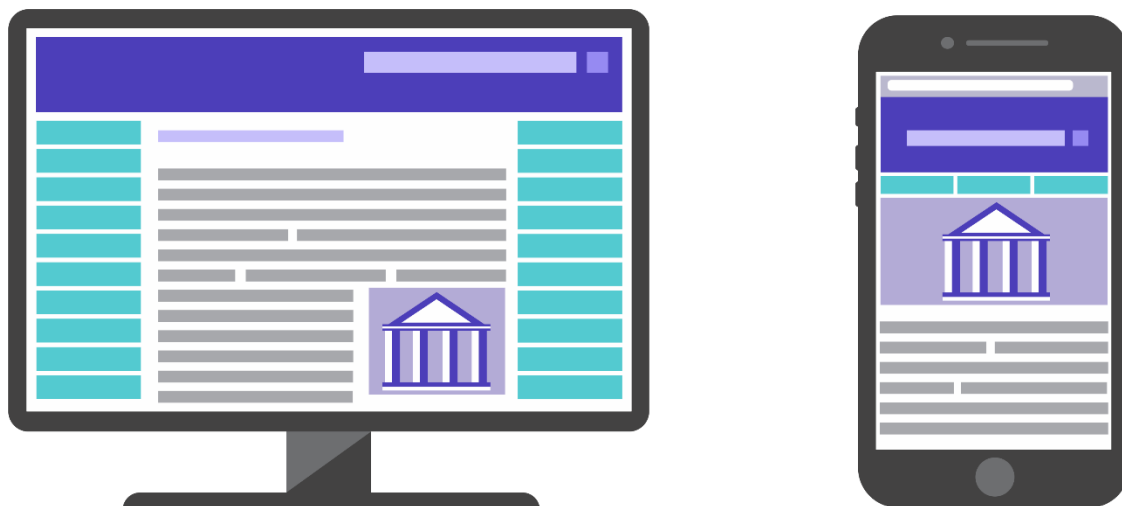
Рисунок 3. Адаптация сайта под мобильные устройства

Адаптация сайта под мобильные устройства подразумевает изменение расположения и размера элементов при их отображении на мобильном устройстве в зависимости от размера и формата экрана (см. рис. 3).