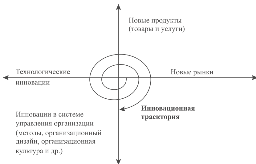
Рис. 1. Траектория системной инновации

Прежде всего, каждой территории присущи уникальные конкурентный ландшафт, природно-географические условия, технологическая и научно-техническая инфраструктура, социальная среда и культурные традиции, рынок трудовых ресурсов, действующая модель системы публичного управления, определяющая стратегию развития территории и механизм ее реализации. Таким образом, даже если для нового географического рынка не требуется адаптации продукта и типовой портрет целевого потребителя принципиально не отличается (это, прежде всего, относится к рынку B2B), указанные ситуационные факторы обуславливают необходимость уточнения предлагаемой ценности для потребителя, переоценки ресурсов