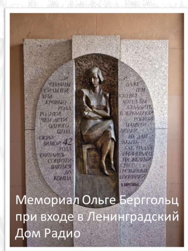
Мемориал Ольге Берггольц при входе в Ленинградский Дом Радио

И надо каждый день в разгуле смерти, Девчоночью откидывая прядь, Политсестрой, Душою Невской тверди У микрофона женщине стоять.