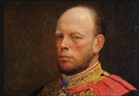
М. Х. Рейтерн