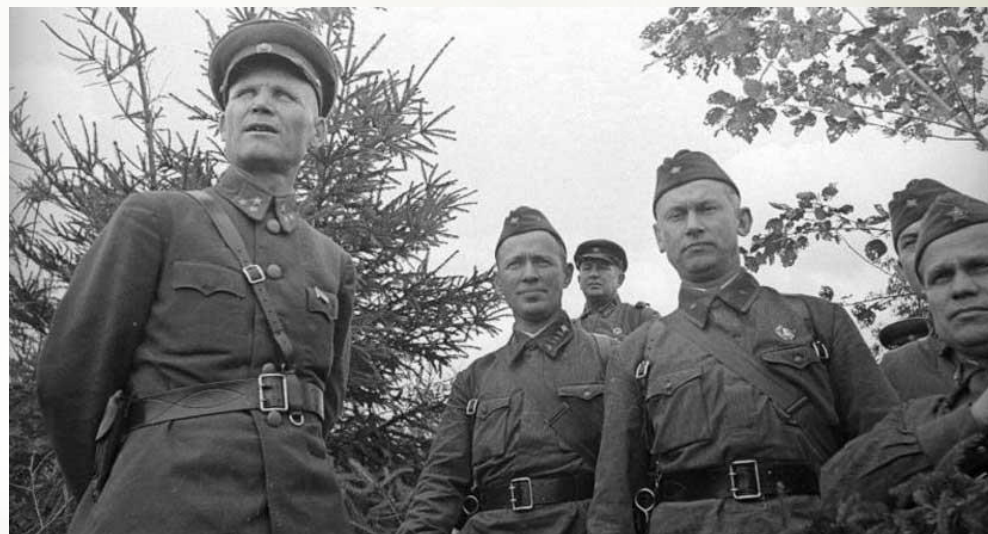
Александр Фадеев и Михаил Шолохов. Слева - командующий 19-й армией, генерал-лейтенант Иван Конев. 1941 год