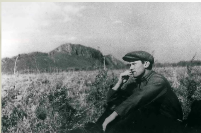
Фадеев в Сучанской долине, 1933 год.