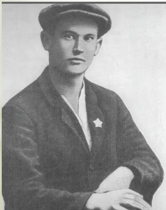
Александр Фадеев 1926г.

Все лето 1921 года Александр Фадеев готовился к поступлению в Московскую горную академию и осенью стал студентом геологического факультета. От учебы его отвлекала партийная работа: будущий писатель одновременно был и секретарем парторганизации факультета, и инструктором Замоскворецкого райкома партии. А с декабря 1922 года Фадеев еще реже появлялся на занятиях: дирекция академии ввела свободное посещение для студентов, которые занимались общественной работой. Вместо лекций по геологии Александр Фадеев посещал открытые дискуссии Анатолия Луначарского или Владимира Маяковского о новой поэзии, ходил в театр и читал литературные журналы «Красная новь» и «Печать и революция».