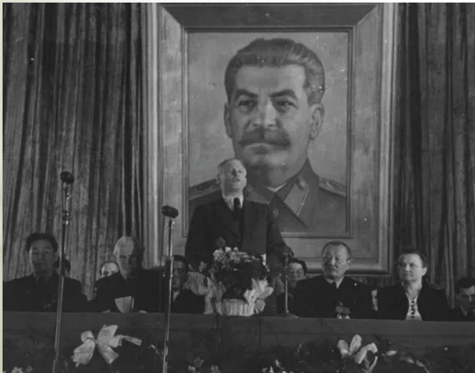
Александр Фадеев (в центре). 1946-1953.

После XX съезда КПСС конфликт Фадеева со своей совестью обострился до предела. Он признавался своему старому другу Юрию Либединскому – Совесть мучает. Трудно жить, Юра, с окровавленными руками.