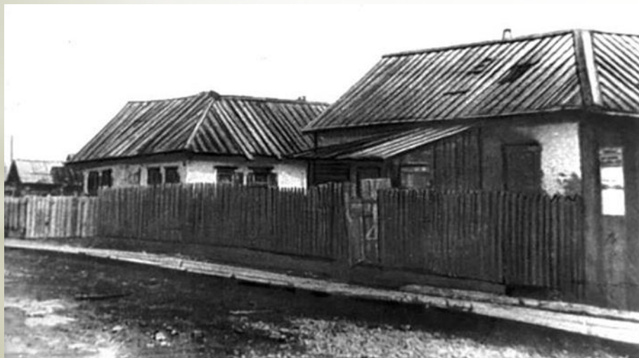
Дом в селе Чугуевке, в котором жила семья Фадеевых с 1908 г. (слева)