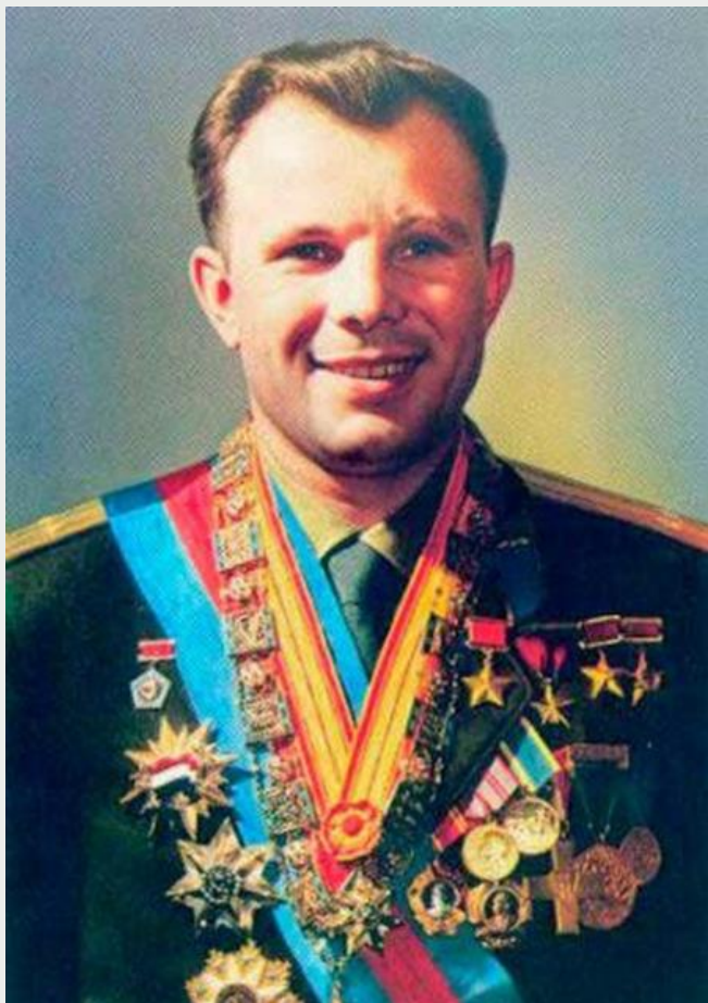
Юрий Алексеевич Гагарин 09.03.1934 – 24.03.1968

Лётчик-космонавт СССР. Герой Советского Союза (1961 г.).