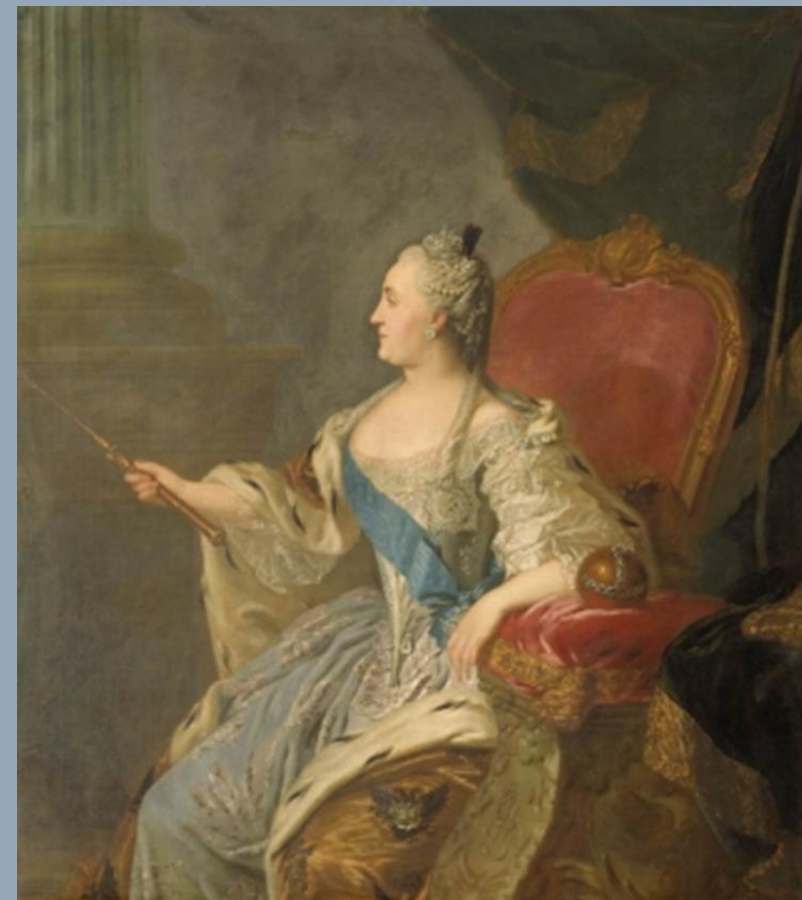
Портрет Екатерины II. худ. Рокотов Федор Степанович, 1763

Истоки праздника восходят к 1769 г. Тогда императрица Екатерина II учредила орден Святого Георгия — высшую воинскую награду Российской империи. Дата возникновения была приурочена ко дню памяти христианского святого, великомученика Георгия Победоносца, которого православная церковь чтит 9 декабря (26 ноября по старому стилю).