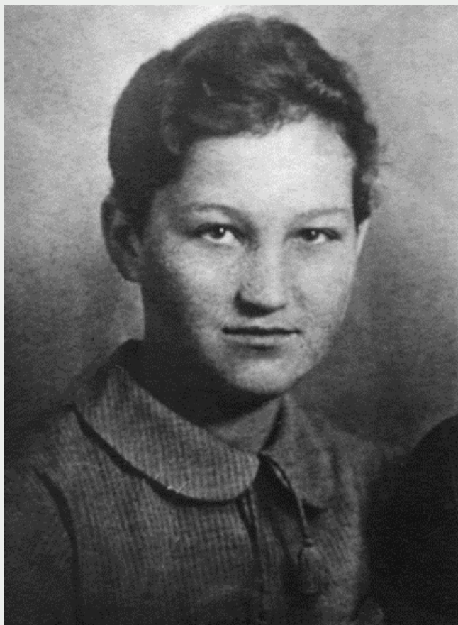
Зоя Анатольевна Космодемьянская