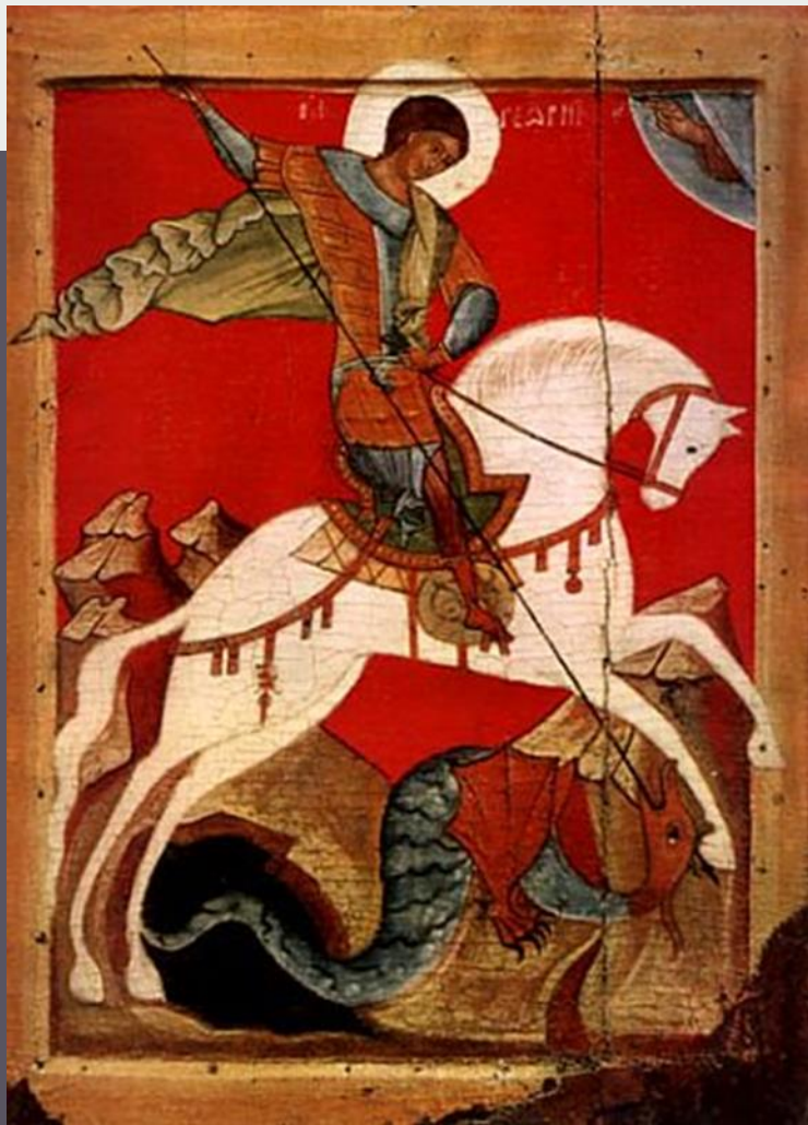
Великомученик Георгий Победоносец