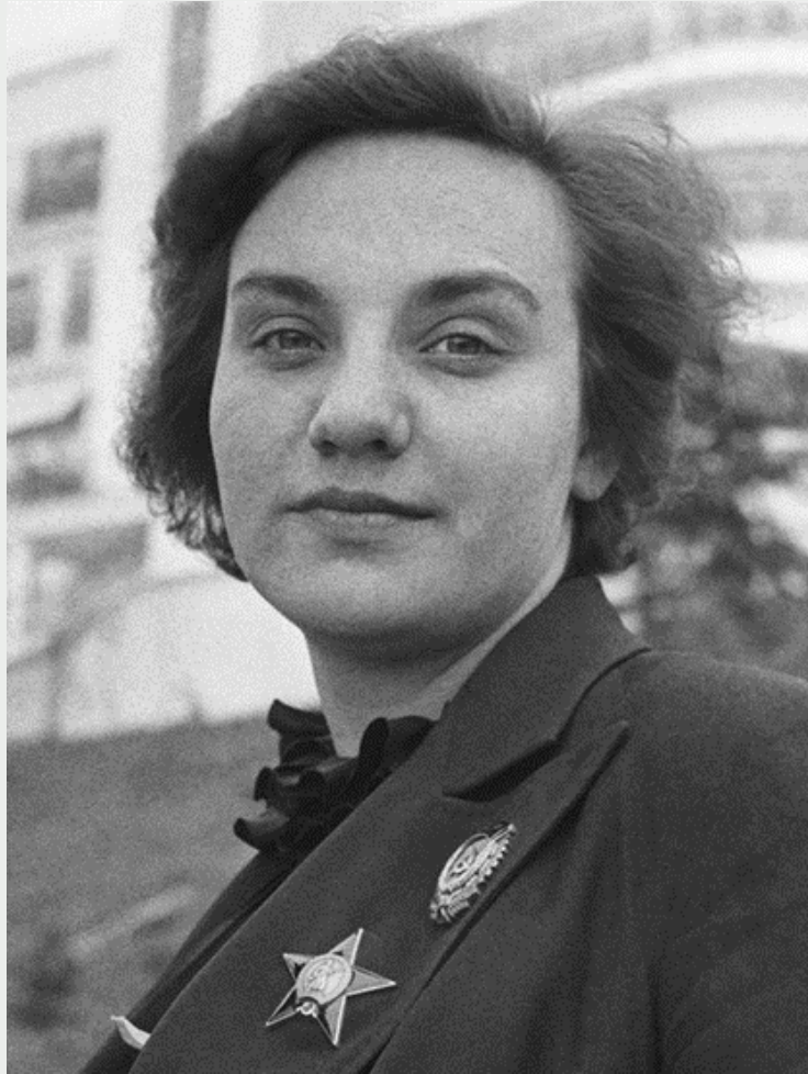
Валентина Степановна Гризодубова 10.05.1909 – 28.04.1993