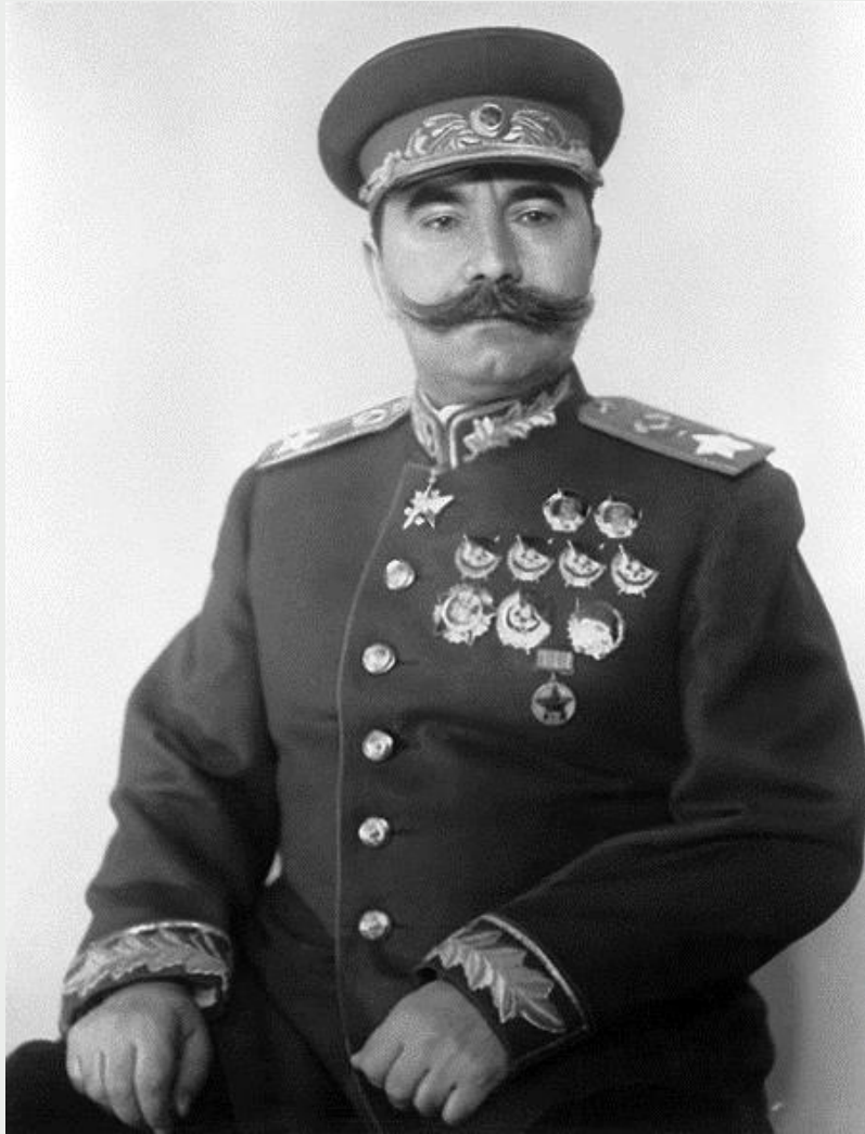
Семён Михайлович Будённый