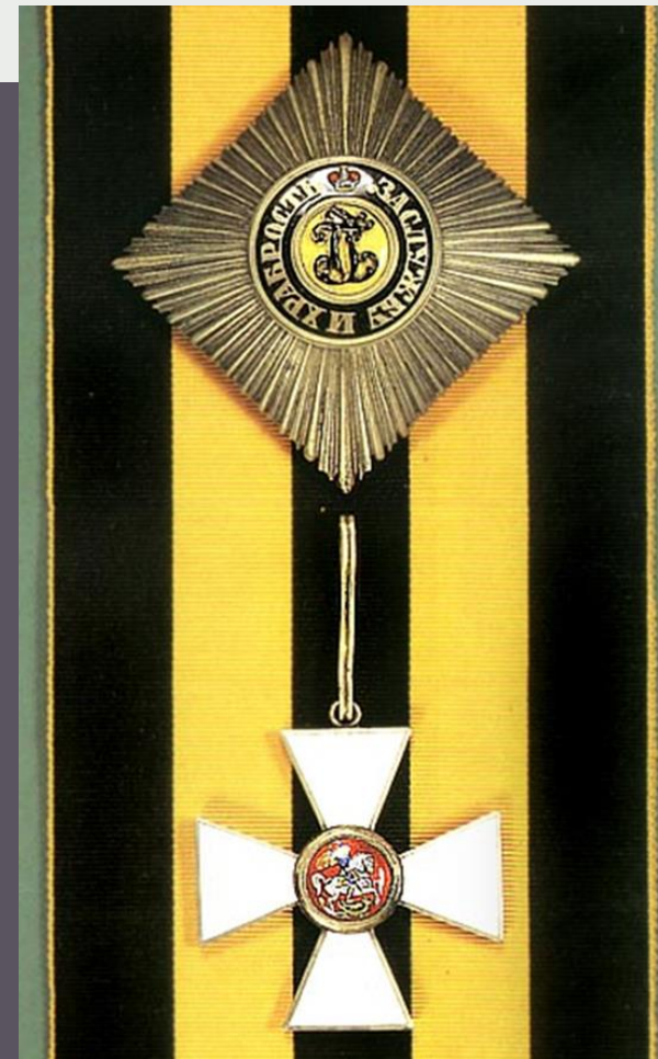
Звезда и крест ордена Св. Георгия 1-й степени