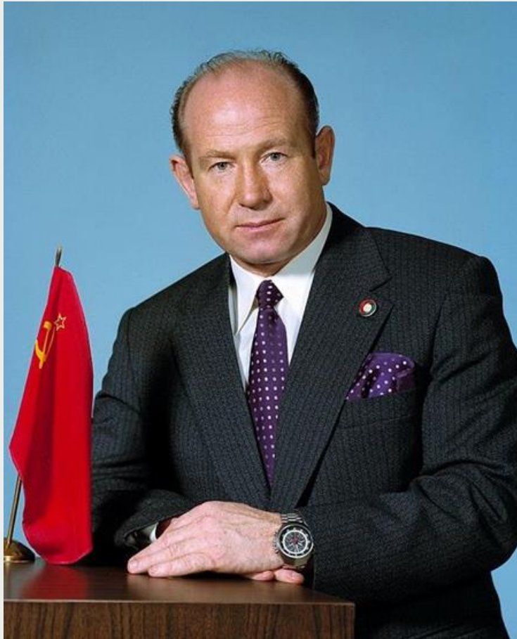
Алексей Архипович Леонов 30.05.1934 – 11.10.2019

В ходе полёта осуществил первый в истории космонавтики выход в открытый космос. Проявил мужество и героизм особенно в нештатной ситуации, когда раздувшийся космический скафандр препятствовал возвращению Алексея Архиповича в космический корабль.