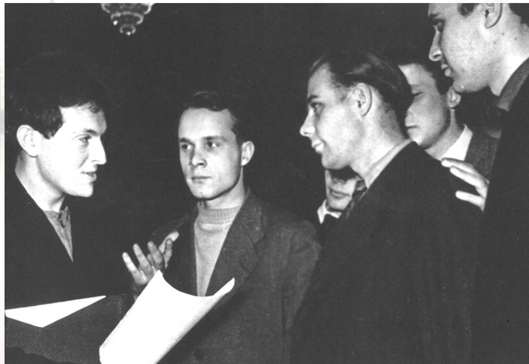
Иосиф Бродский в литературном кружке газеты «Смена». 1958 год.

Интересный факт: личная встреча молодого Бродского и Ахматовой произошла в 1961 году, юный поэт очень понравился Анне Ахматовой, и она взяла его «под свое крыло».