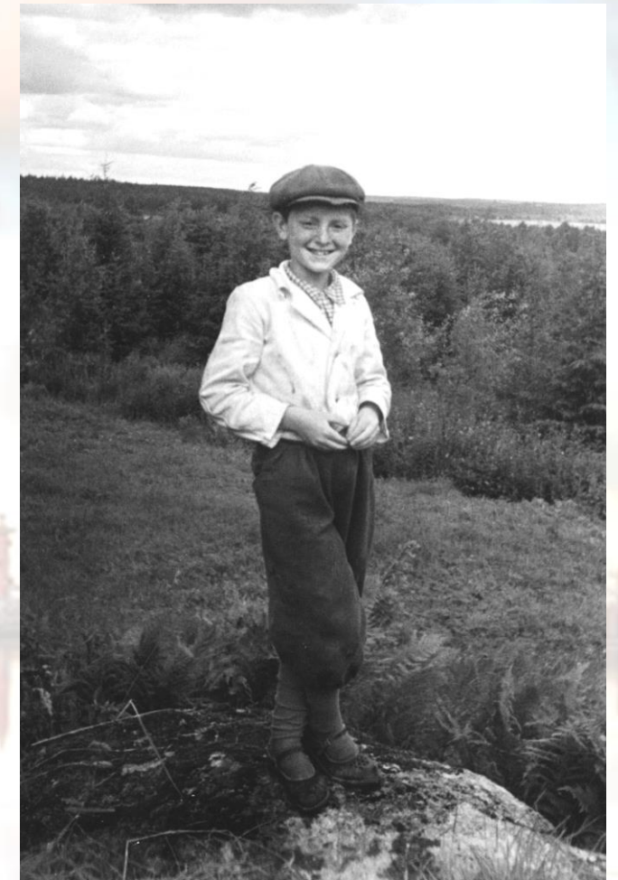
Бродский в Полянах, Ленинградская область. 1948 год.