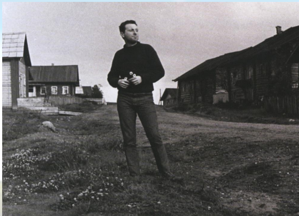
Деревня Норенская, Коношинский район Архангельской области. 1964 год.

18 февраля 1964 года суд постановил направить Бродского на принудительную экспертизу. Так, в психиатрической больнице № 2 в Ленинграде Иосиф Бродский провел три недели и вспоминал о том периоде, как о самом худшем времени в его жизни. 13 марта 1964 года на втором заседании суда Бродского отправили на пять лет в отдаленную местность - для принудительного труда. Но впоследствии Бродский назвал это время самым счастливым в его жизни, так как там у него была возможность изучать английскую поэзию.