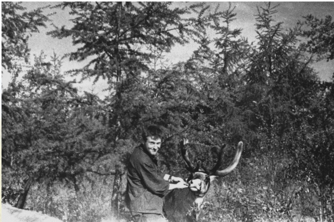
Геологическая экспедиция в Архангельской области. 1957-1958 годы.