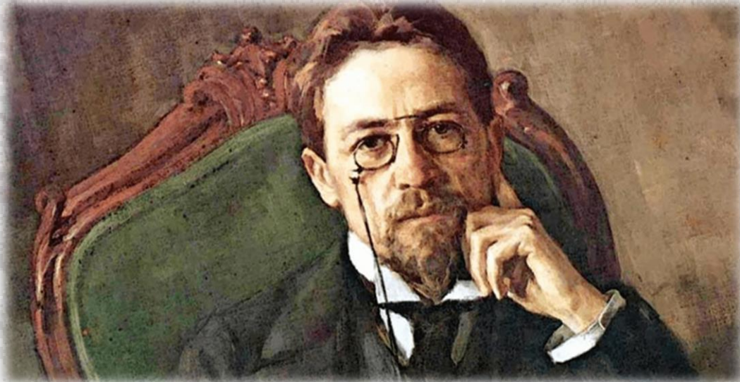
Портрет Чехова работы О. Браз

Пробыв на Сахалине три месяца, Антон Чехов отправился путешествовать, на этот раз по Западной Европе. Писатель побывал в Вене, Болонье, Венеции, Неаполе, где он поднимался на Везувий, в Париже и других городах.