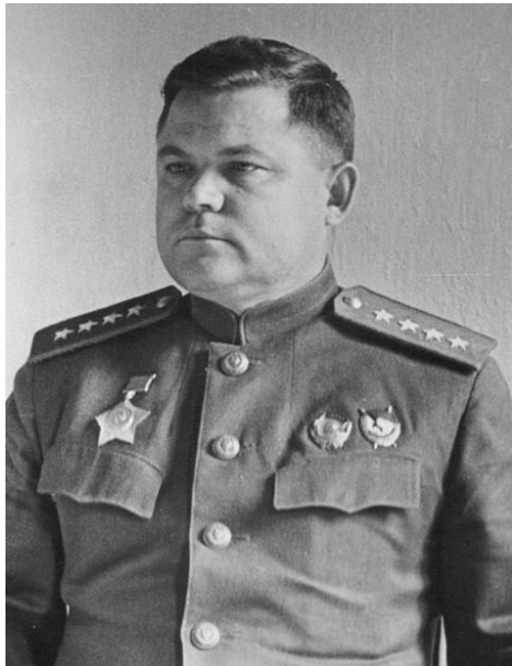
Николай Федорович Ватутин

19 ноября 1942 года — 2 февраля 1943 года — контрнаступление во время Великой Отечественной войны войск трёх фронтов: Юго-Западного (командующий — генерал Н. Ф. Ватутин), Сталинградского (командующий — генерал А. И. Ерёменко) и Донского (командующий — генерал К. К. Рокоссовский) с целью окружения и уничтожения вражеской группировки войск в районе города Сталинграда. Координацию действий трёх фронтов осуществлял начальник Генерального штаба А. М. Василевский.