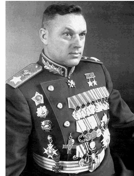
Константин Константинович Рокоссовский